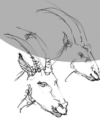
Perle 1 & 2 10 ans 80 Euro / an