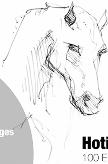
Hotis 29 ans 100 Euro / an

Envoyez vos parrainages avec la fiche jointe à Whitebox Factory 22 Grande Rue 69110 Sainte Foy lès Lyon